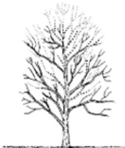
If the height of a tree must be reduced, all cuts should be made to strong laterals or to parent limb. Do not cut limbs back to stubs.

Det finns tillfällen då ett trädets storlek måste reduceras, som till exempel under elledningarna, och det finns tekniker för att göra så. Grenar ska kapas på ett korrekt sätt tillbaka till grenkragen. Om en större gren tas bort måste den mindre som ska ta över tillväxten vara minst 1/3 av diametern av den större. Detta medför även en trädets naturliga form bibehålls. Större snitt bör dock undvikas ef-