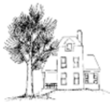
Trees that have been topped may become hazardous and are unsightly.